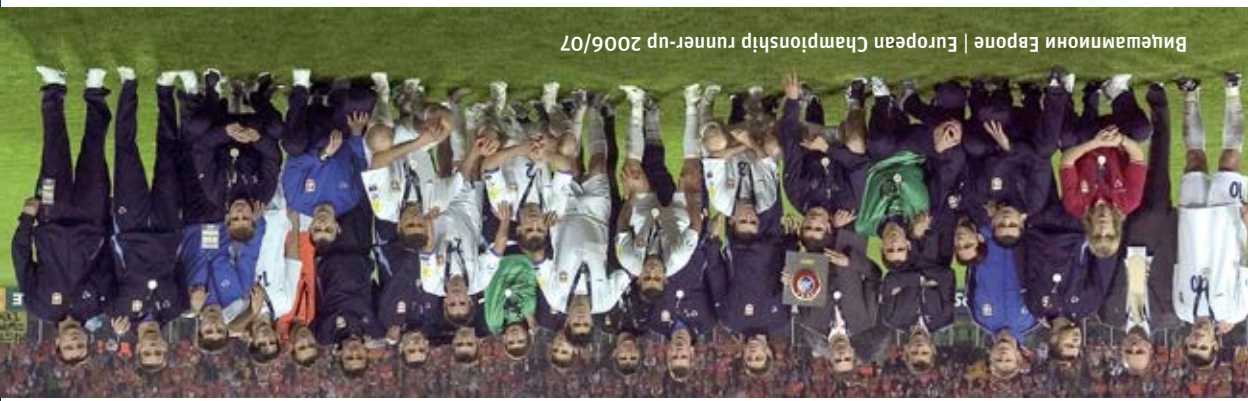
Вицешампиони Европе | European Championship runner-up 2006/07