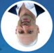
Сенатор ИВИГА СТОЈИЦА

03.02.1998. 29.09.1999. 08.10.1999. 23.03.2000. 21.05.1999. 07.04.1999. 28.01.1999. 16.07.2000. 12.03.1999. 03.03.1998. 08.08.2000. 22.11.1998.