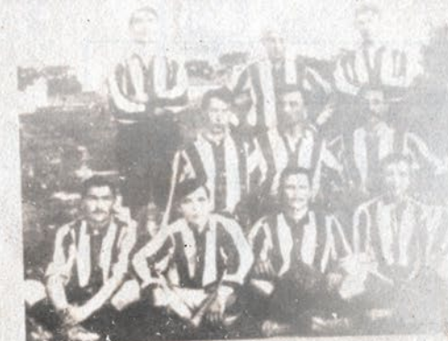
Sports Athletic Club "Bačka", 1901