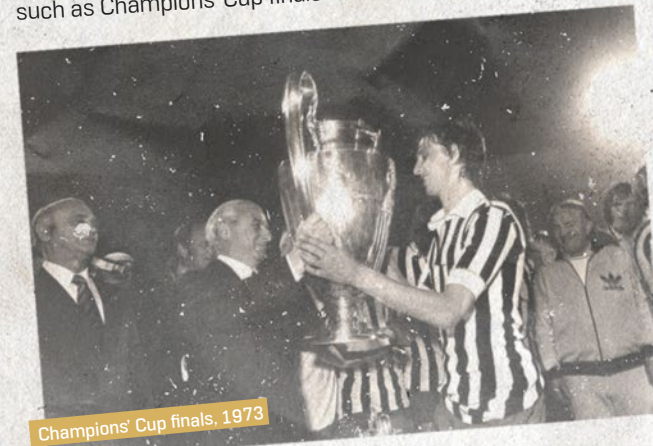
Champions' Cup finals, 1973

Football Association of Serbia has proved its strength as participant in the organization of big competitions, such as Champions' Cup finals in 1973 (Juventus – Ajax, 1:0), and the final tournament of the Nations' Cup in 1976.