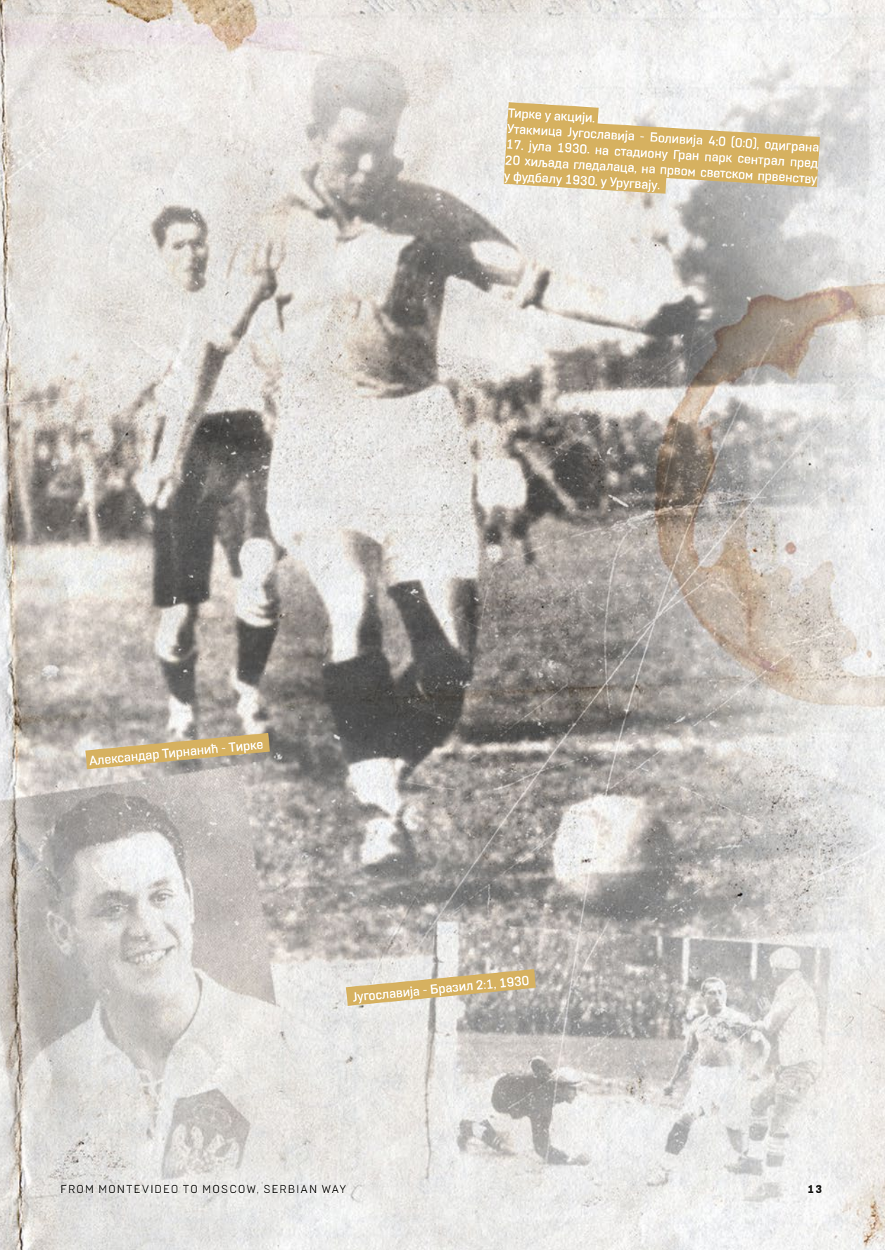
Тирке у акцији. Утакмица Југославија - Боливија 4:0 (0:0), одиграна 17. јула 1930. на стадиону Гран парк сентрал пред 20 хиљада гледалаца, на првом светском првенству у фудбалу 1930. у Уругвају.

Прву утакмицу репрезентација Србије одиграла је 19. маја 1911. и од ХАШК изгубила 0:8. Већ следећег дана, 20. маја, одиграла је и други меч против истог противника и поражена је 0:6. Загребачке новине извештавале су о овим утакмицама уз доста похвала за труд српских фудбалера који су се одважили да изађу на мегдан много бољем противнику. Новине у Србији показале су већ тада да српска јавност поразе не прихвата лако и како саставни део игре. Још ригорознија је била управа "Српског мача". Искључила је непослушне фудбалере из клуба.