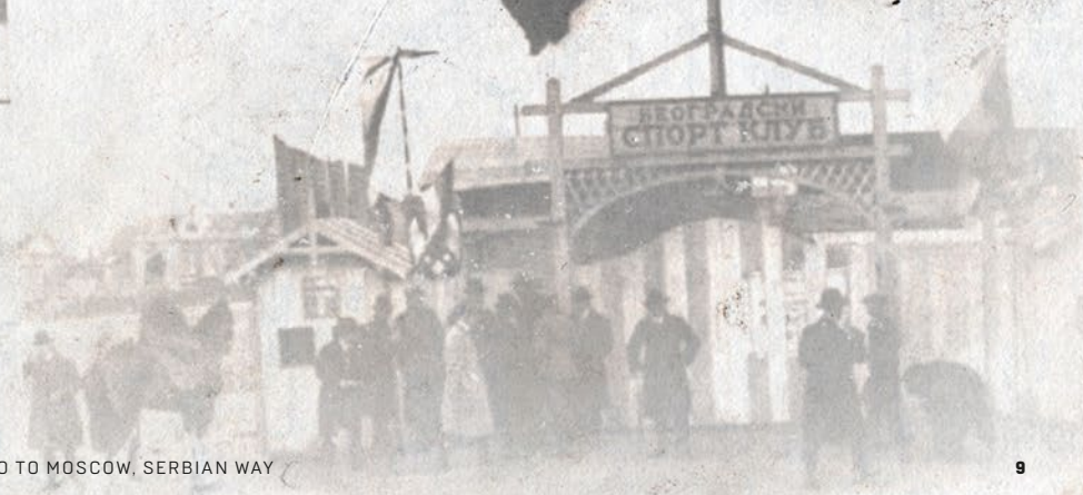
BSK - Belgrade Sports Club